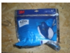
Maska 3M 4 970.00 RSD

Artist Edition, BLK 400-2093 Code Red, ograničena serija po redovnoj ceni 460 din. [Detaljne Informacije...]