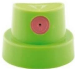
Montana cap level 4 60.00 RSD

Montana level 4 kep je mek tanki kep za srednje sirine u proseku sprej od 3 cm- 10 cm. [Detaljne Informacije...]