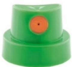
Montana CAP level 5 60.00 RSD

Montana level 4 kep je mek tanki kep za srednje sirine u proseku sprej od 3 cm- 10 cm. [Detaljne Informacije...]