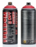
Artist Edition, BLK 400-2093 Code Red 460.00 RSD

Artist Edition, BLK 400-2093 Code Red, ograničena serija po redovnoj ceni 460 din. [Detaljne Informacije...]