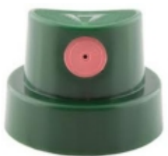
Montana CAP level 6 60.00 RSD

Montana cap level 5 je širok kep za vece sirine u proseku sprej od 4 cm-15 cm. [Detaljne Informacije...]