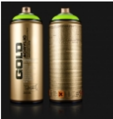
Montana GOLD 550.00 RSD

MONTANA GOLD 204 nijanse akrilna baza, ekstremna pokrivnost-brzina susenja, otporna na vremenske uticaje ... [Detaljne Informacije...]